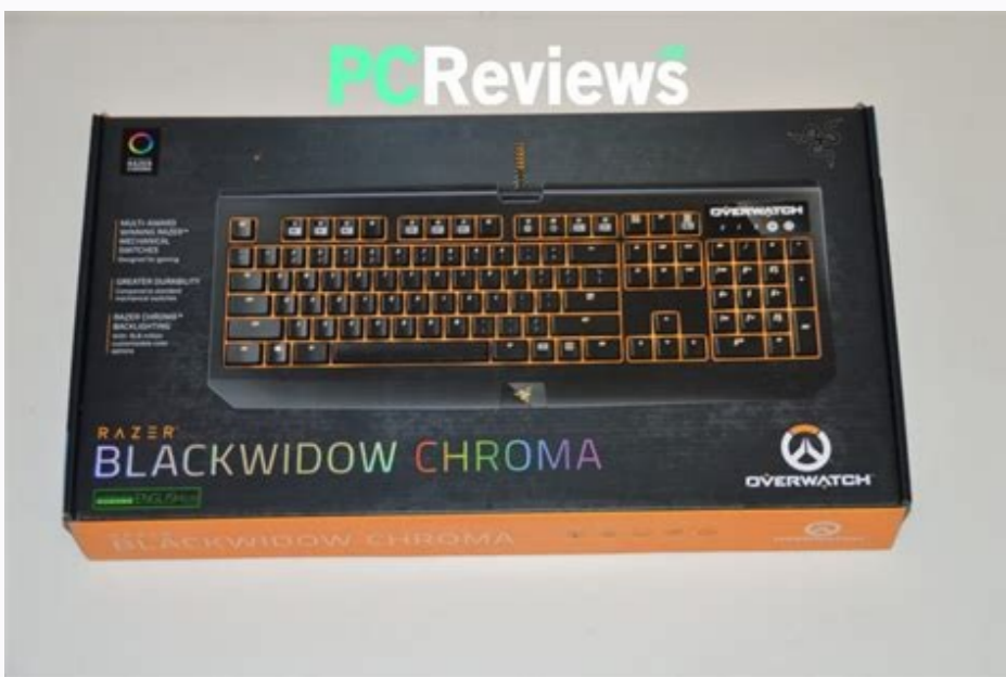
Razer profile location.